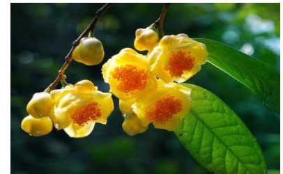
Trà hoa vàng