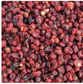
Ngũ vị tử