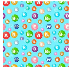
Vitamin + khoáng chất