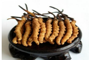
Đông trùng hạ thảo